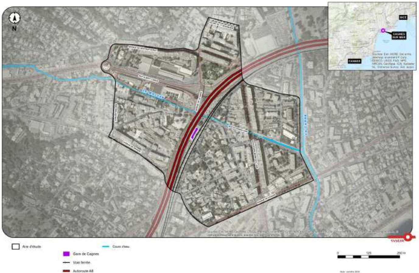
Figure 2: aire d'étude du projet