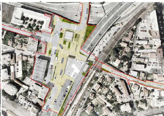
Figure 127 : Plan masse sans le viaduc (AREP)