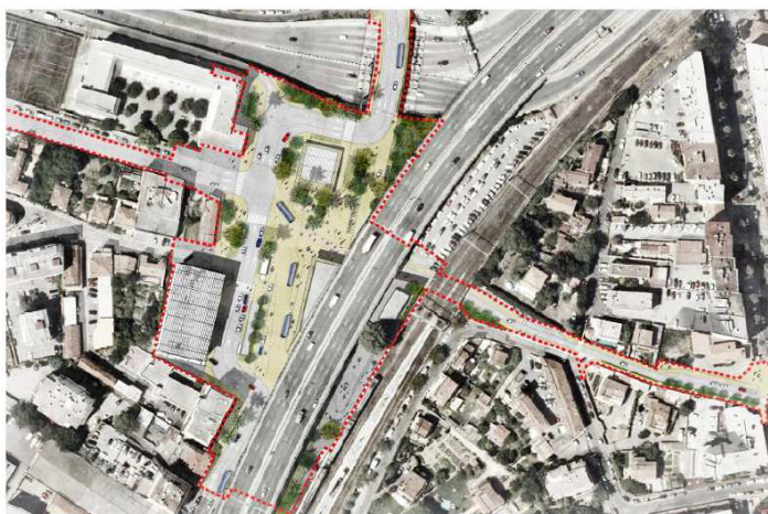
Figure 126 : Plan masse avec le viaduc (AREP)

Le coût du projet est de 21,1 millions d'euros (hors reprise des quais qui s'élève à 0,8 million d'euros 5 ), et hors mesure compensatoire hydraulique (cf. paragraphe 2.3.1).